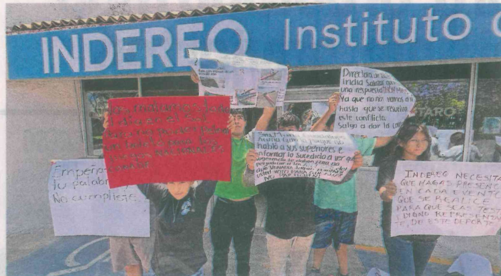
Entre los manifestantes afuera del Instituto del Deporte y la Recreación del Estado de Querétaro había padres de familia, atletas y entrenadores del equipo de canotaje Venados de Jalpan.

Equipo de canotaje de Jalpan acusa arbitrariedad del instituto en selección de representantes del estado