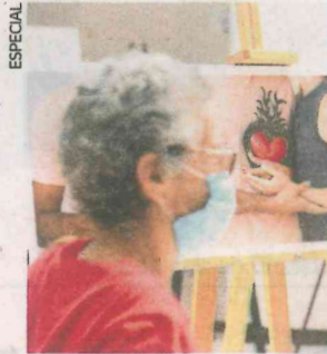
La exposición estará abierta hasta el próximo 8 de mayo